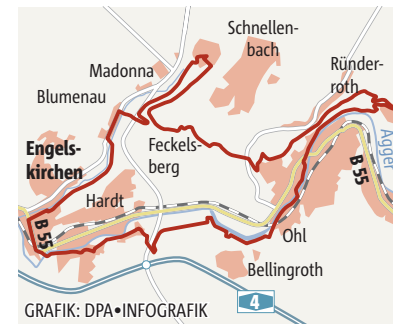
Ziel ist der Ausgangspunkt Rheinisches Industriemuseum. Einkehrmöglichkeiten Stärkung für kleine Wanderer gibt's in der „Pizzeria Mario“ am Rathaus, Tel. 0 22 63 - 43 00. Info Auskünfte bei Naturarena Bergisches Land, Tel. 0 22 66 - 46 33 77, www.naturarena.de

4. Etappenziel Durch das Naturschutzgebiet Weinberg geht's am Aggerufer bis nach Runderoth mit altem Fachwerk und Millionentor, einem Torbogen samt Wohnhaus, dessen Bau im Inflationsjahr 1923 Millionen verschlang. Zum Einkehren: „Baumhof“, Hauptstr. 18, Tel. 0 22 63 - 90 28 38. An der ehemaligen Wasserburg „Haus Ley“ vorbei geht's zurück nach Engelskirchen.