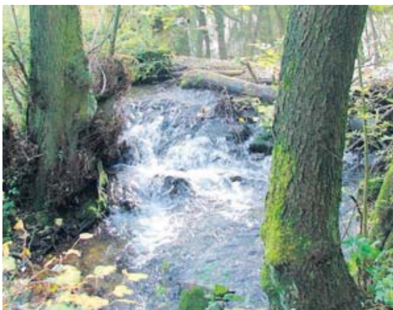
Beim Kneippwanderweg steht das Wasser im Vordergrund. Auf drei Routen sprudelt und gurgelt es. Gekneippt wird in natürlichen Tretstellen.