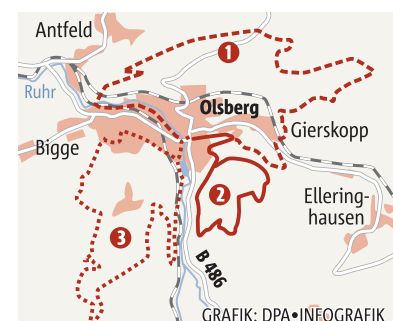
„Schinkenwirt“ (s. Hotels), „Café Hagemeister“, mit Gartenterrasse an der Ruhr und köstlicher Kuchenauswahl, Ruhrstraße 9, Tel. 0 29 62 - 97 66 667 Info Tourenbeschreibung und mehr Auskünfte bei Touristik & Stadtmarketing Olsberg, Tel. 0 29 62 - 97 37 0, www.olsberg.de

2. Etappe 13 km. Diese kürzere Strecke hat es in sich, denn es geht auf den 704 Meter hohen Olsberg. Der Klippenweg führt steil bergan. Oben belohnt ein toller Ausblick. Auf großen Felssteinen schmeckt die mitgebrachte Brotzeit. Auf dem Rückweg bietet die Luisenquelle Abkühlung für die Füße und Köstliches für die Kehle 3. Etappe 17 km. Am Stausee entlang in Richtung Steinhelle. In Helmeringhausen Einkehrmöglichkeiten im Dorf-Gasthof Freisen-Leutner. Dann geht's hinauf auf den 729 Meter hohen Gipfel des Ohlenbergs. Von dort aus kommt man zur Kneipp-Tretstelle Vossbach. Weiter in Richtung Bigge, dann nach Olsberg Einkehrmöglichkeiten in Olsberg Leichte und regionale Küche beim