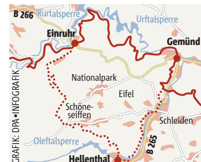
getränkte Printen und Wildnis-Trail-Menüs, Tel. 0 24 44 - 91 42 00). Angebot Ein Arrangement für 165 € p.P. (im DZ) mit drei Übernachtungen (und Frühstück), Kartenmaterial und Gepäcktransfer. Aufpreis für Halbpension 45 € Info Nationalpark-Tor Gemünd, Tel. 0 24 44 - 20 11, www.naturerlich-eifel.de

3. Etappe Von Einruhr nach Gemünd, 21 km, 550 Höhenmeter. Die Tour verläuft am Ufer des Obersees bis zu Urftalsperre. Sie zu erklimmen (54 Meter), lohnt sich, auf der anderen Seite locken ein schöner Blick und ein Ausflugslokal mit Eifeler Spezialitäten (und Kachelofen für kalte Tage, Tel. 0 24 21 - 57 047). Bergauf geht es zur Wüstung Wollseifen, von dort zur Burg Vogelsang. Die ehemalige NS-Ordensburg ist seit 2006 für Besucher geöffnet, eine Ausstellung (10 bis 17 Uhr) informiert über die Geschichte Ziel ist der Ausgangspunkt Gemünd. Einkehrmöglichkeiten: das Bistro mit regionaler Küche im „Hotel Friedrichs“, Alte Bahnhofstraße 16, Tel. 0 24 44 - 95 09 50 (DZ ab 92 €) und das Café-Restaurant „Zum alten Rathaus“ am Marienplatz (Spezialität: mit Els-Schnaps