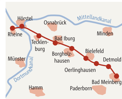
0 59 71 - 54 055, www.verkehrsverein-rheine.de Info Der Hermannsweg bildet mit dem Eggeberg die Hermannshöhen: Sie gehören zu den Top Trails, den zehn schönsten deutschen Wanderwegen. Auskünfte bei OstWestfalenLippe Marketing, Tel. 05 21 - 96 733 25, www.teutoburgerwald.de

6. Etappe Bis Oerlinghausen, 14 km. Ob am Abend zuvor oder zu Beginn des Tages – unbedingt einen Abstecher wert ist die Sparrenburg aus dem Jahr 1240. Durch den Wald führt der Weg bis Oerlinghausen 7. Etappe Bis Detmold, 15 km. Vorbei an den Rethlager Quellen und der 20 Meter tiefen Quellschlucht geht es zum 54 Meter hohen Hermannsdenkmal, das an den Cheruskerfürsten Hermann erinnert 8. Etappe Bis Horn-Bad Meinberg, 16 km. Auf der letzten Etappe wird's mystisch. Um die Externsteine ranken sich Sagen, auf den Klippen wartet eine tolle Aussicht Angebot Sieben Übernachtungen (im DZ, inkl. Frühstück), sieben Lunchpakete, Kartenmaterial, 359 € p.P., 426 € im EZ. Gepäcktransfer auf Anfrage, z.B. zu buchen über Verkehrsverein Rhein, Tel.