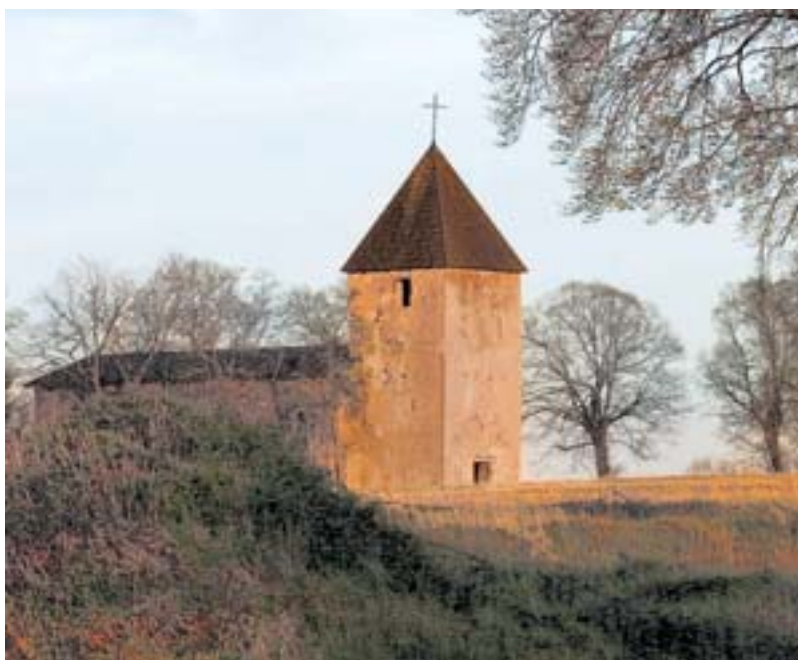
Am dritten und letzten Tag führt der Weg auf der Rur-Olef-Route an der Kirche in der Wüstung Wollseifen vorbei.