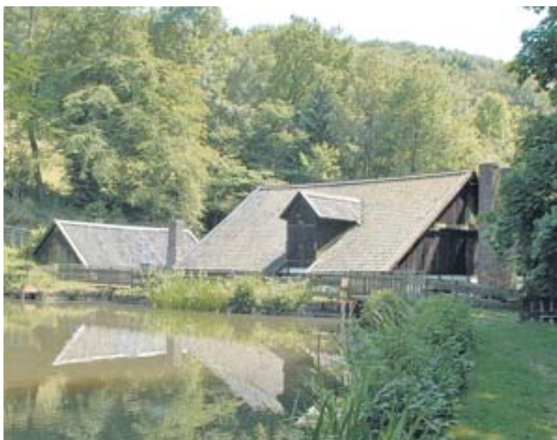
Erstes Etappenziel bei der 15,5 Kilometer langen Strecke ist an einem Weiher in der „Oelchenshammer“, eine wasserbetriebene Schmiede.